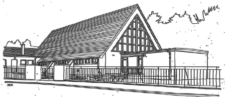
Drawing by John R Hume